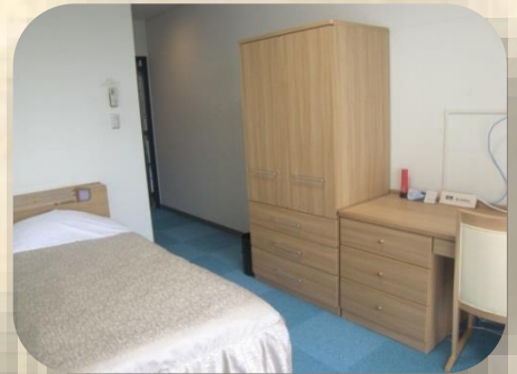
シングル (Single room)