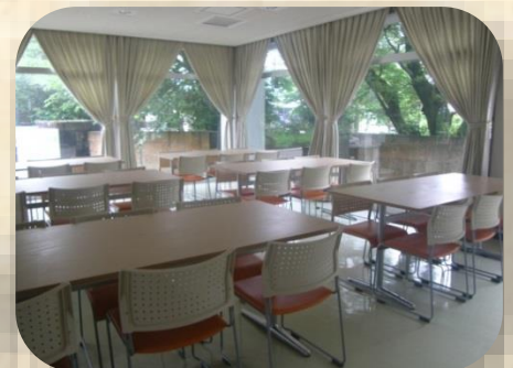
食堂 (Dining room)