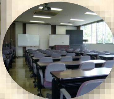
セミナー室 (Seminar room)