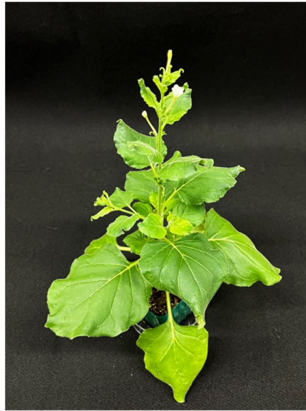
図 1 ベンサミアナタバコ

ベンサミアナタバコ ( Nicotiana benthamiana 、図 1、以下「 N. benthamiana 」) は、植物科学において最も広く用いられている実験モデル植物の 1 つです。多様な植物病害、特に植物ウイルス病に対して感受性が高い (病気にかかりやすい) ため、植物病理学においては古くから研究対象となってきました。最近では COVID-19 のワクチン製造へ利用できるということで注目されています。一方、これまでの研究により、 N. benthamiana は植物の接木において高い接着力を持っており、植物ではこれまで実現が不可能であるとされていた、異なる科に属する植物間の接木 (異科接木) が可能であることが示されました。