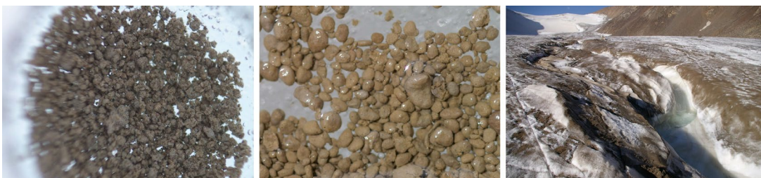
図2:(左)グリーンランドのクリオコナイト

このように物質循環や氷河融解の観点から注目されてきたクリオコナイトですが、これまでの研究では一部の微生物やその微生物の生理機能しか調査されておらず、特に微生物群集のゲノムに関する情報はほとんどありませんでした。したがって、クリオコナイト内でどのような微生物種がどのような活動をしているのか、その実態はあまりわかっていませんでした。