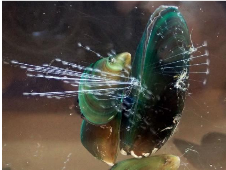
図1 足糸を張って水槽壁面に付着しているミドリイガイ