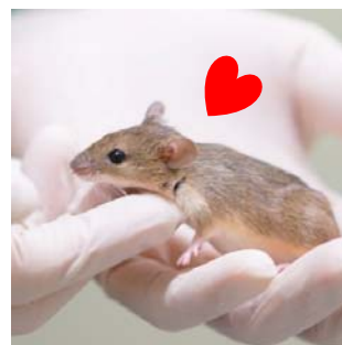
遺伝的にヒトに「なつく」行動を示すマウス

家畜化された動物の従順性とは「動物個体が人を避ける傾向が弱くなる」か、あるいは「積極的に人に近づく傾向が強くなること」の二つに分けられます。私たちは、この二つの従順性を分けて調べる行動テストを考案しました。この行動テストを用いて、その結果を基に遺伝的に多様な野生由来マウス集団を選択交配することで、自らヒトに「なつく」マウスを作出することに成功しました。このヒトになつくマウスを用いて、遺伝的基盤、神経回路、行動学的基盤について研究しています。