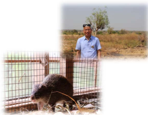
アフリカの大型齧歯類グラスカッター

西アフリカに生息する大型齧歯類であるグラスカッターはその肉が美味であることから現地で食用として珍重されています。しかし、もっぱら野生個体の捕獲により食されているため環境への悪影響や感染症の広がり懸念されます。そこで、グラスカッターを家畜化するためのプロジェクトに参加し、ガーナ大学、エジンバラ大学、京都大学と共同でゲノム育種を進めています。