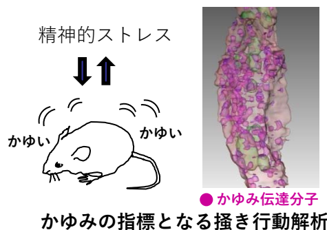
かゆみの指標となる搔き行動解析

痒みの感受性は絶対的なものではなく、環境要因や社会的要因により大きな個人差が生まれます。また、ストレスを受けると痒みが悪化したり、痒みを連想するだけで痒くなったり、情動や認知機構と痒みは密接にリンクしています。私たちは、行動遺伝学・神経解剖学という観点から、社会性が痒み感覚に与える影響とその遺伝的基盤の解明に取り組んでいます。