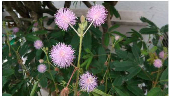
▶ オジギソウの花 [草]