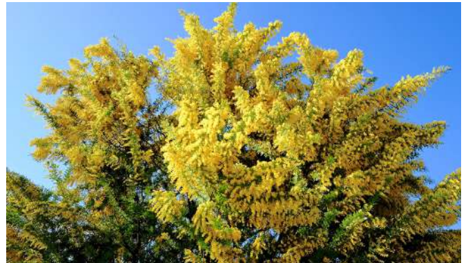
▶ ミモザの花 [木]