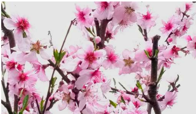
▶ アーモンドの花 [木]

桜と同じバラ科の植物は、他にもこんな植物があるよ。アーモンド、もも、なし、ボケ、ヘビイチゴ など。おなじみの植物が多いね。