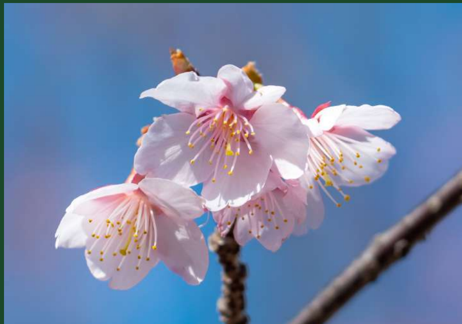
▶これは遺伝研に咲く熱海桜だよ。2月の中旬に咲いていたよ。