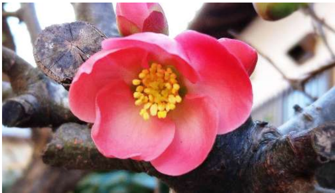
▶ ボケの花 [木]