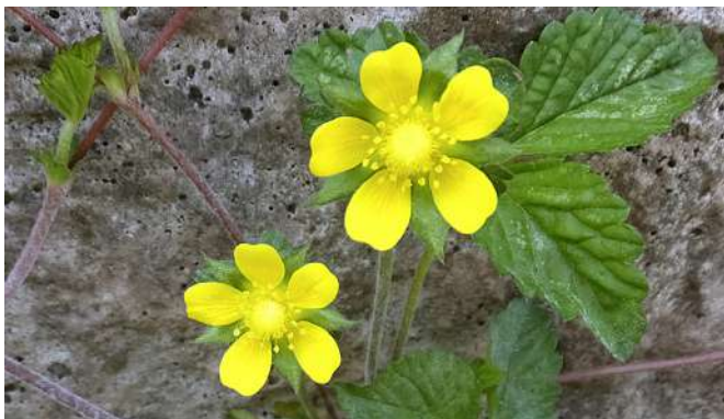
▶ ヘビイチゴ [草]