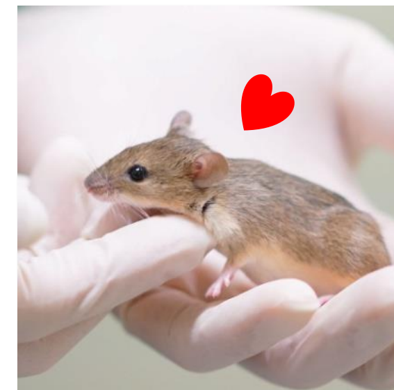
遺伝的にヒトに「なつく」行動を示すマウス

家畜化された動物の従順性とは「動物個体が人を避ける傾向が弱くなる」か、あるいは「積極的に人に近づく傾向が強くなること」の二つに分けられます。私たちは、この二つの従順性を分けて調べる行動テストを考案しました。この行動テストを用いて、その結果を基に遺伝的に多様な野生由来マウス集団を選択交配することで、自らヒトに「なつく」マウスを作出することに成功しました。このヒトになつくマウスを用いて、遺伝的基盤、神経回路、行動学的基盤について研究しています。