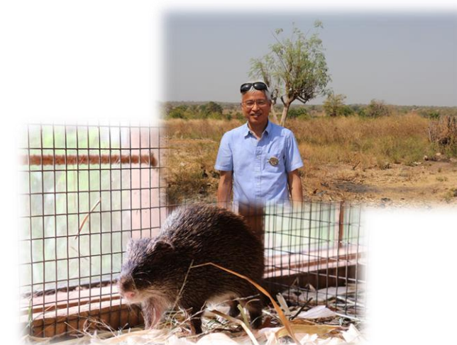
アフリカの大型齧歯類グラスカッター

西アフリカに生息する大型齧歯類であるグラスカッターはその肉が美味であることから現地で食用として珍重されています。しかし、もっぱら野生個体の捕獲により食されているため環境への悪影響や感染症の広がりが懸念されます。そこで、グラスカッターを家畜化するためのプロジェクトに参加し、ガーナ大学、エジンバラ大学、京都大学と共同でゲノム育種を進めています。