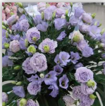
Eustoma grandiflorum (トルコギキョウ 1.4 Gbp)