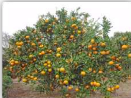
Citrus unshiu (温州ミカン 360 Mbp)