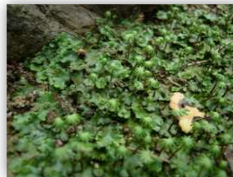
Marchantia polymorpha (基部陸上植物・ゼニゴケ 220 Mbp)