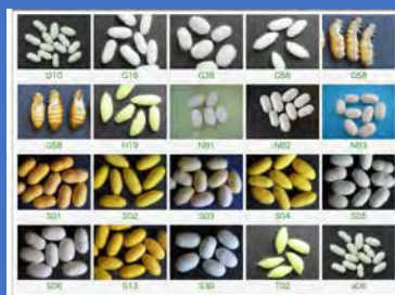
モデル生物のゲノム配列DBや画像DB