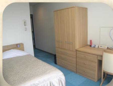
シングル (Single room)