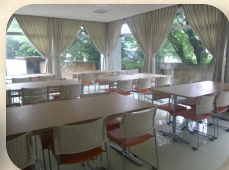
食堂 (Dining room)