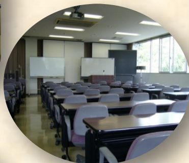
セミナー室 (Seminar room)