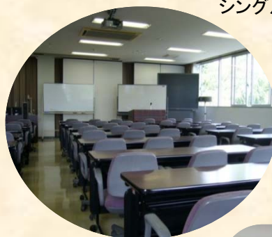
セミナー室 (Seminar room)