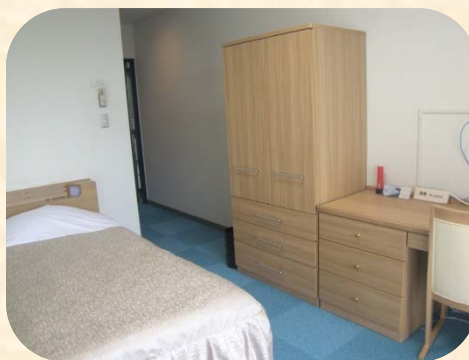
シングル (Single room)