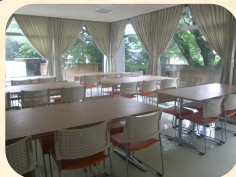
食堂 (Dining room)